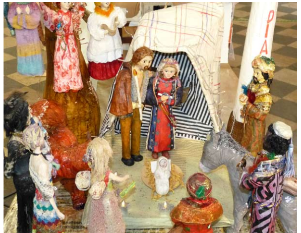
Une crèche de l'édition 2016

La mise en route s'effectue en mai-juin avec la proposition du thème, choisi chaque année en phase avec l'actualité. En 2017, « Le CLIMAT » se réfère, vous vous en doutez, à la COP 23. Fin août, lancement des inscriptions des exposants. Puis, phase incontournable, de multiples autorisations sont à solliciter auprès des pouvoirs publics.